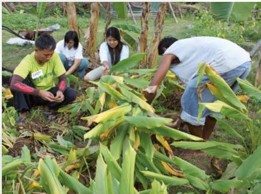
Uitleg aan een deelnemende groep

We willen komen tot een wereldvisie die ons, mensen, leidt naar een goede manier van leven op onze aarde.