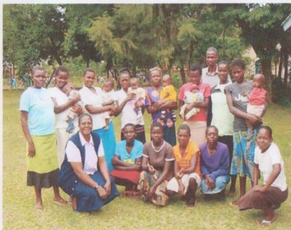
2de Groep . 12 Jonge moeders

Zij zijn gekomen in de hoop iets te leren waar mee ze in hun levens onderhoud kunnen voorzien en de richting van hun leven kunnen bepalen naar hun eigen normen en waarden.